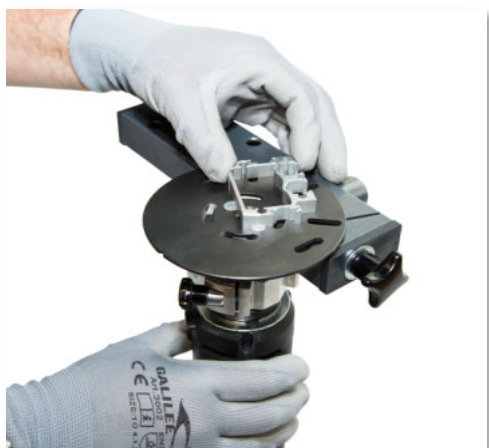
45° Kontur-Fasen stationär