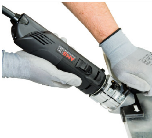
45° Fasen mobil mit Prisma