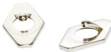
5 Konturanschläge (4x lose, 1x im Freiform-Aufsatz)