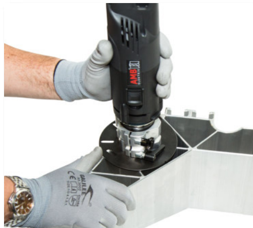
45° Kontur-Fasen mobil