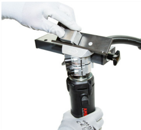
45° Fasen stationär mit Prisma